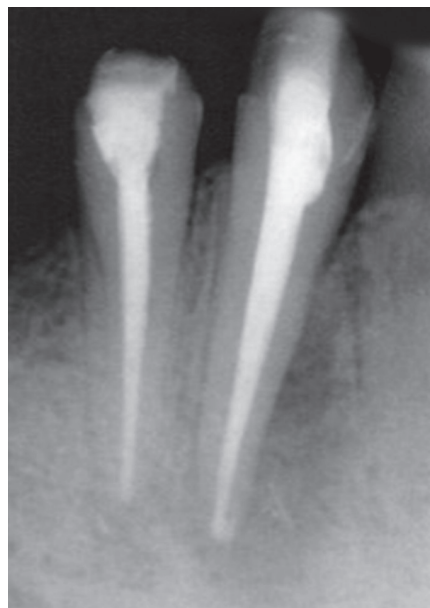
Рис. 5. Рентгенограмма от 12.03.2010 после пломбирования каналов 4.3 и 4.4