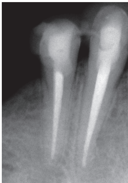
Рис. 6. Контрольная рентгенограмма через 2 года после пломбирования канала. Март 2012 г.