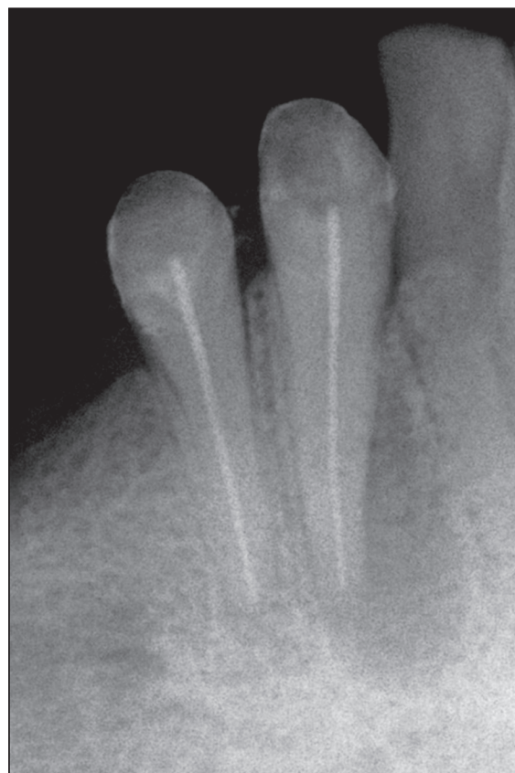
Рис. 1. Исходная ситуация

4. На рентгенограмме обнаруживается контрастное вещество в каналах 4.3 и 4.4 зубов. Пломбирование каналов было оценено мной как неполное и неплотное. В области верхушки корня 4.4 разрежение костной ткани до 2 мм, в области верхушки и самого корня 4.3 с медиальной стороны разрежение костной ткани до 10 мм с четкими краями. Костных карманов не обнаружено. Вершина межзубной костной перегородки между 4.4 и 4.3 зубами сглажена, межзубная костная перегородка между 4.3 и 4.2 не визуализируется в данной проекции (рис. 1).