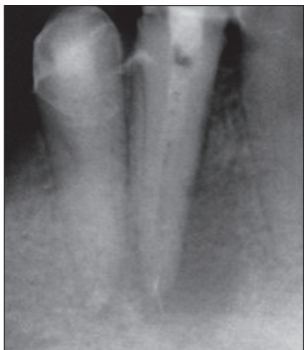
Рис. 2. Рентгенограмма 4.3 и 4.4 после распломбировки каналов и заполнения их пастой Calasept. В апикальной части канала видны следы старой корневой пломбы. Фрагмент гуттаперчевого штифта за пределами корневого канала