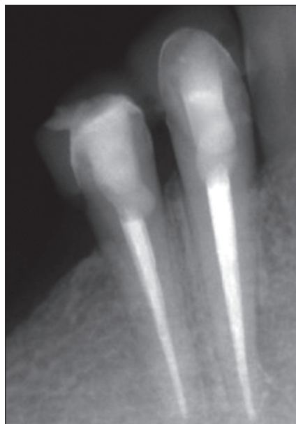
Рис. 7. Контрольная рентгенограмма через 4 года после пломбирования канала. Ноябрь 2013 г.

4.3 зуба (рис. 4). Под инфильтрационной анестезией Ultracain DC 1,8 ml с изоляцией 4.4 и 4.3 при помощи коффердама были удалены временные пломбы из стеклоиономера. Каналы 4.3 и 4.4 были промыты 3% раствором натрия гипохлорита, высушены и запломбированы методом латеральной конденсации гуттаперчи с герметиком AN+ (рис. 5). После контрольной рентгенограммы коронковые части 4.3 и 4.4 были герметизированы композитным восстановительным материалом Filtek Supreme (включая Filtek Supreme Flow) с применением SingleBond.