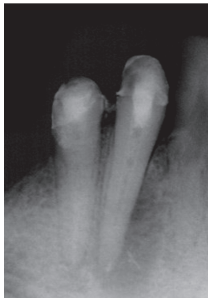
Рис. 4. Контрольная рентгенограмма от 12.03.2010 до пломбирования каналов 4.3 и 4.4